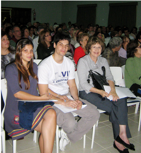
VISTA PARCIAL DO PÚBLICO QUE LOTOU O AUDITÓRIO DO GRUPO REGENERAÇÃO