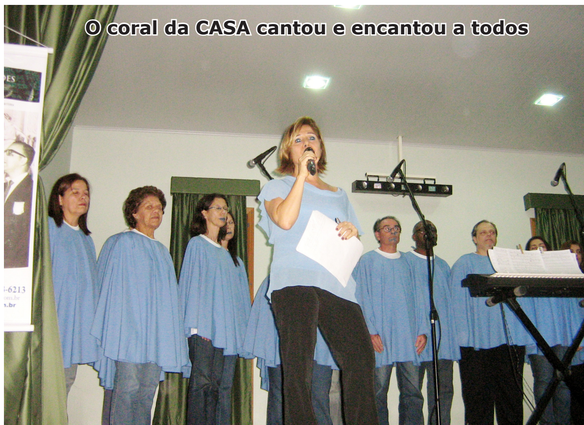
© coral da CASA cantou e encantou a todos